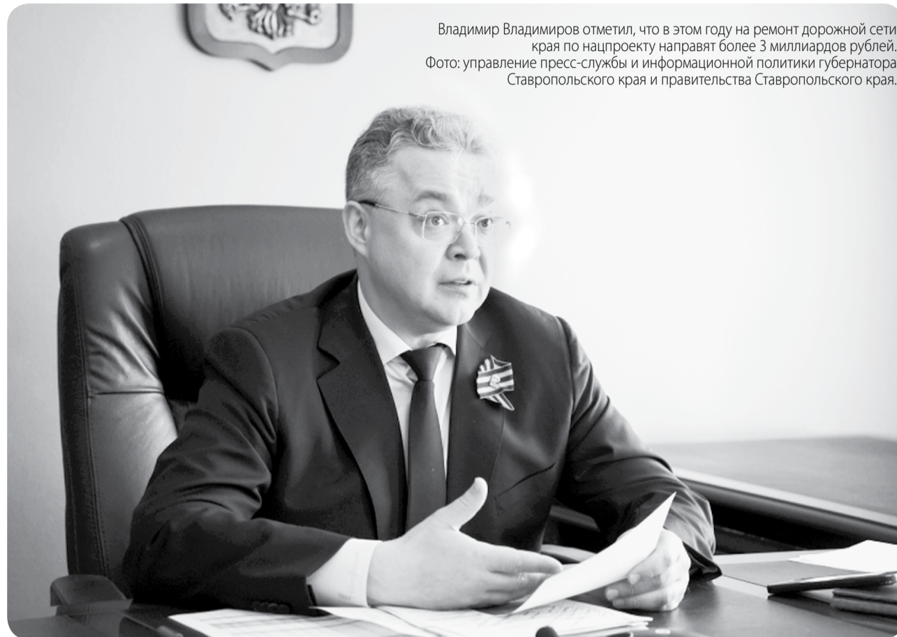
Владимир Владимиров отметил, что в этом году на ремонт дорожной сети края по нацпроекту направят более 3 миллиардов рублей.

Дополнительное соглашение к меморандуму о совместной работе по развитию автомобильных дорог общего пользования в рамках реализации нацпроекта «Безопасные качественные дороги», инициированного президентом России, предусматривает пятилетнюю программу совместной работы по развитию дорожной сети.