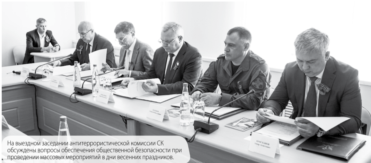
На выездном заседании антитеррористической комиссии СК обсуждены вопросы обеспечения общественной безопасности при проведении массовых мероприятий в дни весенних праздников.

Текст и фото управления пресс-службы и информационной политики губернатора Ставропольского края и правительства Ставропольского края