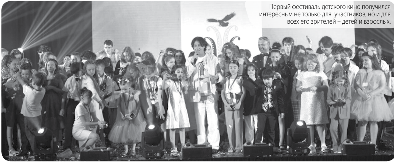
Первый фестиваль детского кино получился интересным не только для участников, но и для всех его зрителей – детей и взрослых.

В Ессентуках в начале июля пройдет второй по счёту фестиваль детского кино «Хрустальный Источник».